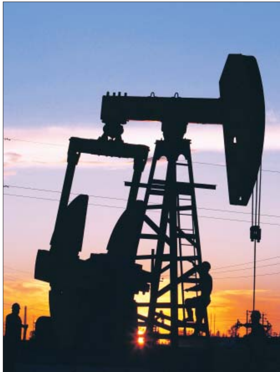
Ein Szenario, wonach die Ölproduktion schon 2012 das Maximum erreicht haben könnte und danach sinken werde, treibt den Ölpreis an.

Das führt uns zu den Verlierern des Ölpreisanstiegs. Zu den wichtigsten gehören die Unternehmen, die im treibstoffintensi-